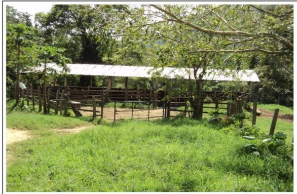
Nº 11. VISTA VAQUERA