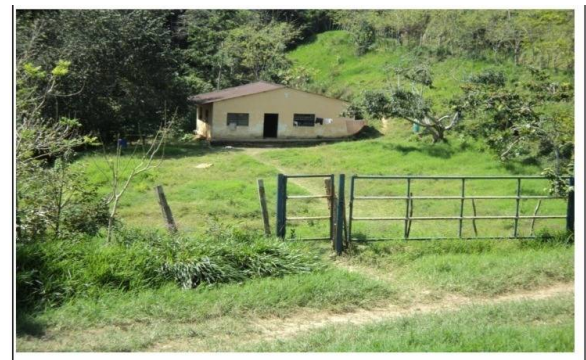
Nº 15. VISTA GENERAL VIVIENDA