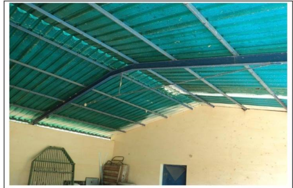
Nº 16. VISTA INTERNA VIVIENDA