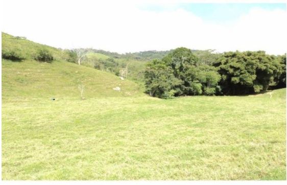
Nº 17 VISTA GENERAL POTREROS