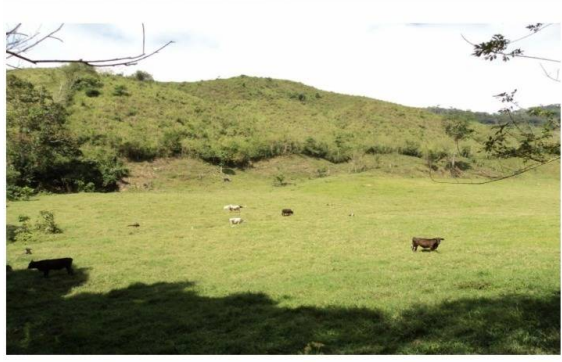
Nº 18 VISTA SEMOVIENTES EN POTREROS

Caracas, Chacao, Caracas, Miranda T 04129709790 | c21premiumve@gmail.com