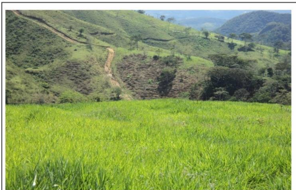
Nº. 3. VISTA POTREROS Y VIALIDAD INTERNA