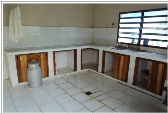
Nº 14. VISTA INTERNA QUESERA