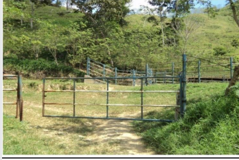
Nº 9. VISTA ENTRADA A LA UNIDAD DE PRODUCCION