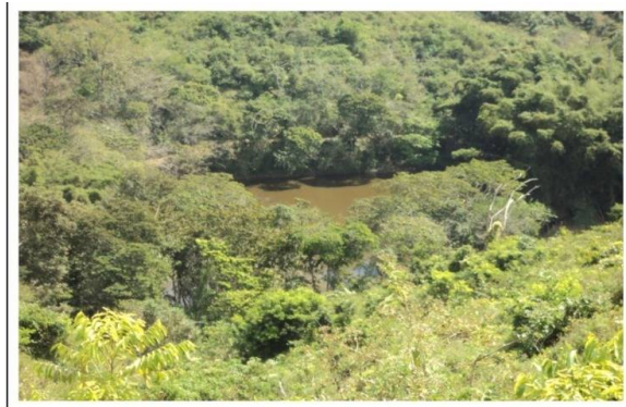
Nº. 5. VISTA PANORAMICA DE LAGUNA