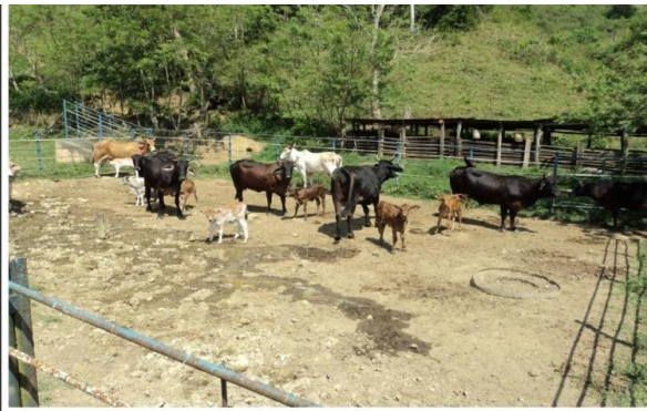
Nº 7. VISTA SEMOVIENTES EN CORRAL