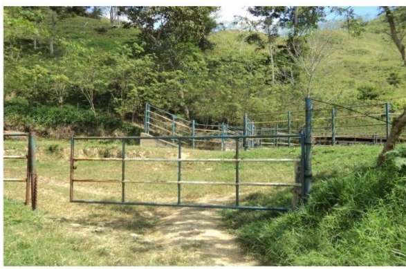
Nº 9. VISTA ENTRADA A LA UNIDAD DE PRODUCCION