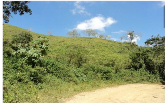
Nº 1. VISTA GENERAL POTREROS