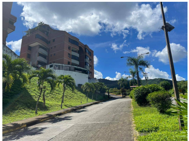
Centro Empresarial CIUDAD CENTER, 5ta Transversal (Av. Sanatorio del Avila) Torre E, piso 5,,Sucre, Caracas, Miranda